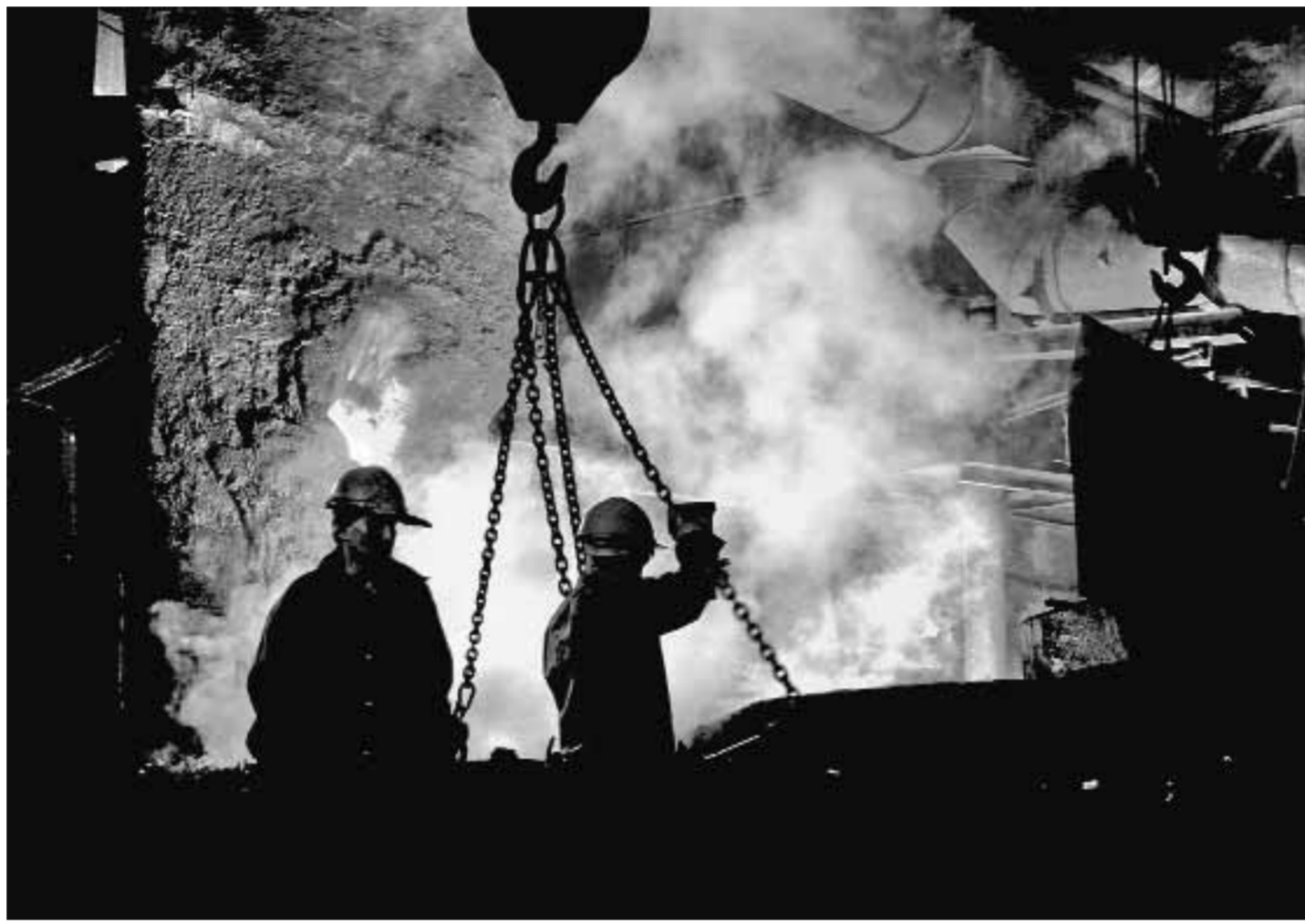
Черная металлургия уверенно восстанавливает свои ценовые позиции на мировом рынке

Европе на темпы восстановления мировой экономики, можно ожидать завершения коррекции и начало восстановления цен на стальную продукцию.