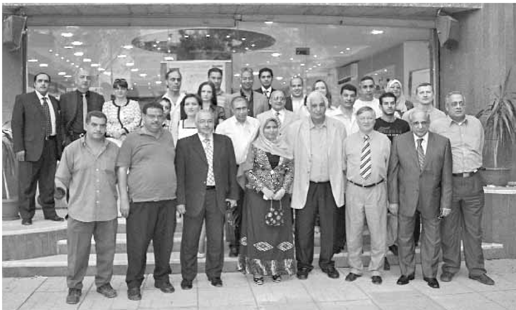
Российская выставка в Каире собрала достойных

ботает на рынке товаров и услуг России и СНГ, около 10 лет реализует программу содействия развитию экономических и культурных отношений России с государствами Африки и странами арабского мира. У Ассоциации — официальное представительство в Королевстве Марокко и